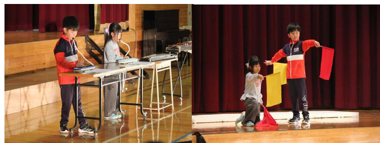
低学年の発表。二人きりの演技演奏でしたが、とても力強さが伝わりました！