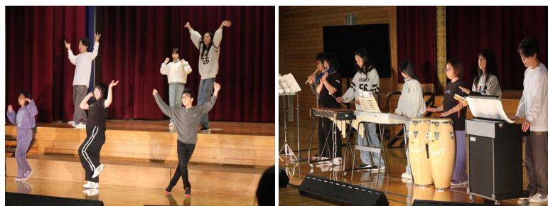
高学年の発表。完成度の高い内容はさすが！最後のステージを盛り上げました！