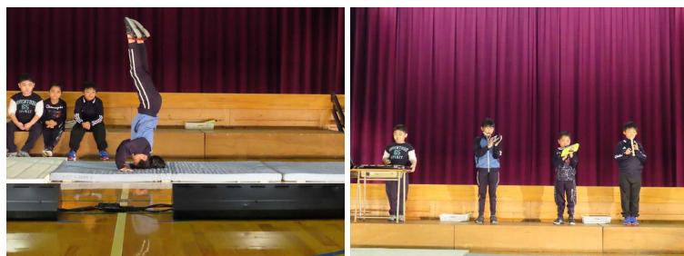
中学年の発表。手話付きの「にじ」の曲は泣けました！